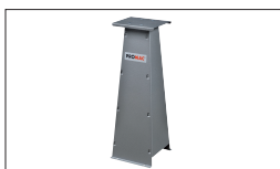
Réf. 9399 Socle universel 290 x 300 x 830 mm