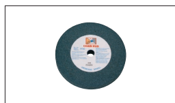
Réf. 9341 Meule Gr60 200 x 25 x 20 mm