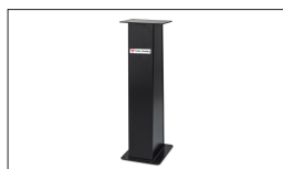
Réf. TF-SG Socle universel 290 x 300 x 830 mm