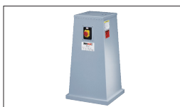
Réf. 300Z Socle motorisé 230V avec arrêt d'urgence et aspi- ration ø 36 et ø 100 mm : 470 x 490 x 870 mm