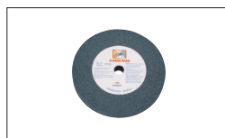
Réf. 9340 Meule Gr36 200 x 25 x 20 mm