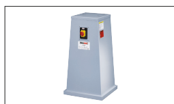
Réf. 300Z Socle motorisé 230V avec arrêt d'urgence et aspi- ration \varnothing 36 et \varnothing 100 mm : 470 x 490 x 870 mm