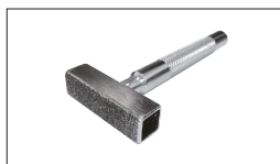
Réf. 2231 Dresse meule diamanté