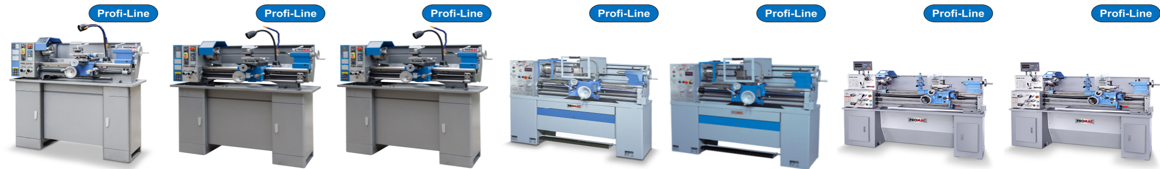
inkl. Maschinenunterbau inkl. Maschinenunterbau inkl. Maschinenunterbau inkl. Maschinenunterbau inkl. Maschinenunterbau inkl. Maschinenunterbau inkl. Maschinenunterbau