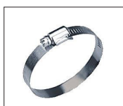
Réf : JW1022 Collier de serrage galvanisé