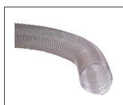
Réf : J-10000312 Tuyau en PVC transparent, Ø 100mm à 5m