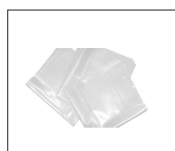
Réf : 709563 Sac de recharge (pack de 5 sacs)