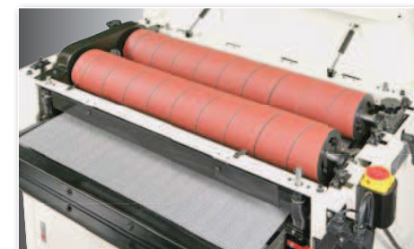
2 cylindres abrasifs pour le ponçage grossier et fin, en une étape de travail