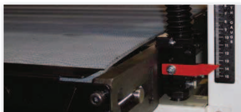
Le tapis d'entraînement est placé dans 4 broches massives