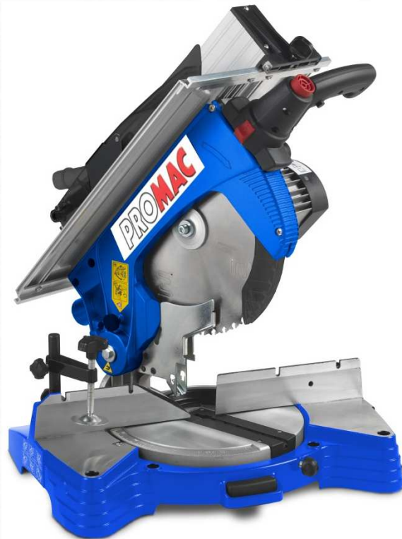
Moteur à induction