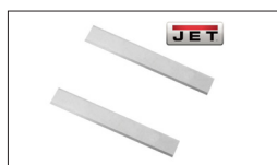
Réf 707411 2 lames HSS