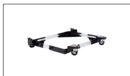
Réf : 708118 Dispositif roulant jusqu'à 250kg