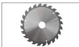
Réf : 10000050 Lame ø250 x 30 x 3 mm 40 dents