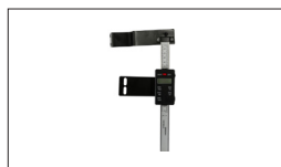
Réf : 723552 Afficheur Numérique