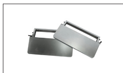
Réf : 723551 Tables d'entrée / sortie pliantes