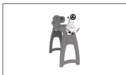
Réf. 719001 Dispositif de pivotement de la contre-poupée