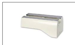
Réf. 6294727B Rallonge du banc de machine, 460 mm