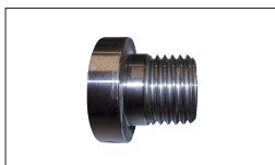
Réf. 10000450 Adaptateur 1" F x 8TPI / M33 x 3.5"