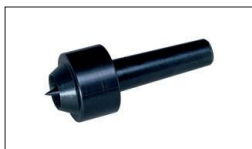
Réf. 708331 Contre-pointe tournante CM2