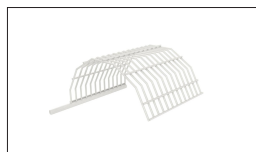
Réf. 719002 Grille de protection