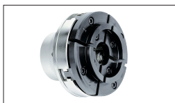
Réf. 10000600 Mandrin de tournage, M33 x 3.5, ø 100 mm, standard, avec mors de type C