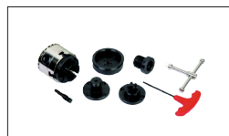
Réf. 10000610 Mini mandrin 1" X8 TPI