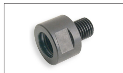
Réf. 709960 Adaptateur M33F x 3.5 mm / 1" M x 8TPI