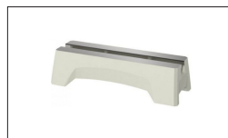
Réf. 719401 Rallonge du banc de machine, 508 mm