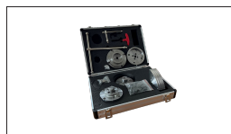
Réf. CK-2.75Z / S1 Mandrin de tournage à 4 mors ø 70 mm