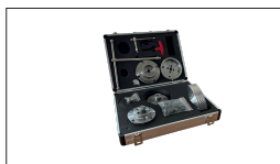
Réf. CK-4.5Z / S1 Mandrin de tournage à 4 mors ø 114 mm