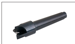
Réf. JWL-1642-102 Griffe d'entraînement 4 DTS CM2