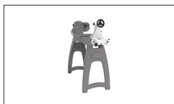
Réf. 719001 Dispositif de pivotement de la contre-poupée