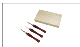
Réf. 10000614 Outils tournage bois HSS L165 mm (3 pcs)