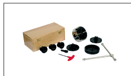
Réf. 10000612 Mini mandrin M33 x 3.5 ø 115 mm