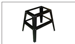
Réf. 10000842 Socle ouvert