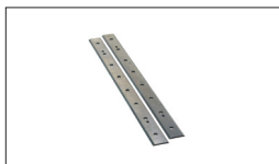
Réf. 10000841 Fers de rabot HSS, 319 x 18 x 3 mm