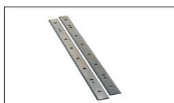
Réf : 10000841 Série de 2 lames HSS