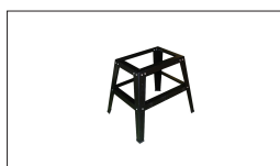
Réf : 10000842 Socle ouvert