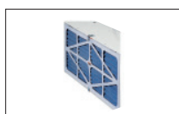
Réf. 708731 Filtre extérieur électrostatique