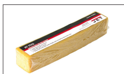
Réf : J-60-0505 Bâton de nettoyage