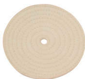
Disque polissage 9339 175 x 20 x 12 mm