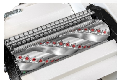
Tête Hélicoidale 3 rangées de 17 plaquettes