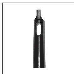
Réf. 2087 Douille réduction CM3/CM2