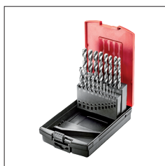
Réf. D-19GS Coffret 19 forêts HSS Co de 1 à 10 mm par 0.5