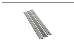
Réf : 10000287 Série de 3 lames HSS 260 x 25 x 3 mm