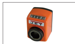
Réf : 10000291 Affichage numérique de rabotage