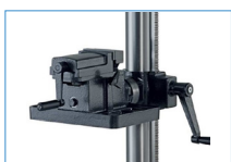
PGM : 350 x 250 == > réf 2834 Table pivotante étau