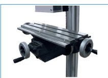
TC : 475 x 153 == > réf 2836 Table croisée