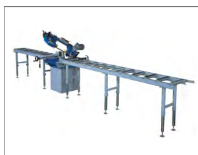
Réf. 2017C Table standard