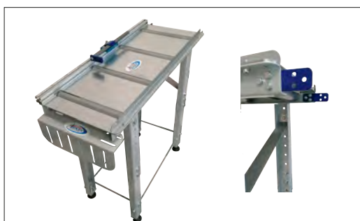
Réf. TFT1M Table entrée ou sortie par 1m