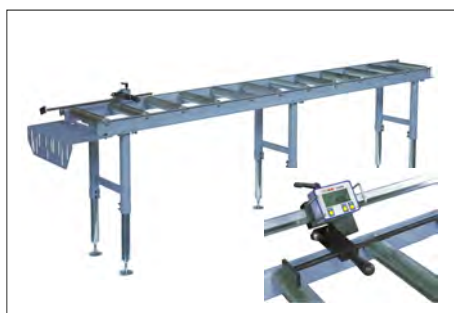
Réf. 2020 Table standard