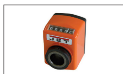
Réf : 10000291 Affichage numérique de rabotage