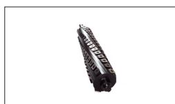
Réf : 1791212 Série de 10 plaques pivotantes quadruples